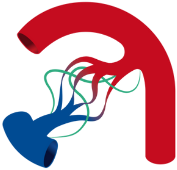
Схема на действие при еризипел за пациенти с лимфедем

Утвърдено от Работната група за педиатричен и първичен лимфедем (PPL).